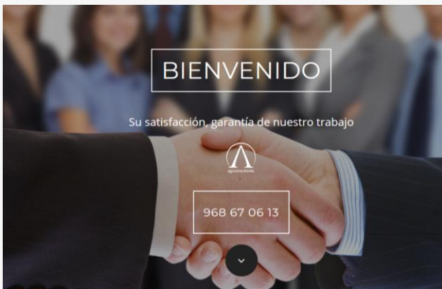
Diseño web para Consultoría Laboral y Contable.