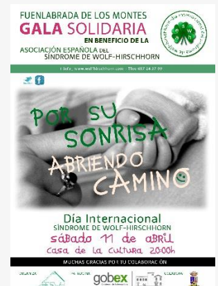
Cartel de Jornadas Universitaria y Gala Solidaria AESWH