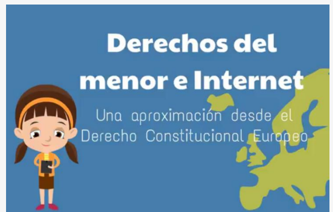
Derechos del menor e Internet. Una aproximación desde el Derecho Constitucional Europeo.